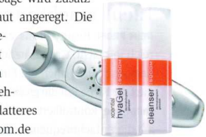
„SQOOM“ VON SCHICK MEDICAL

ZU HAUSE: Der Minicomputer „SQOOM“ (ab 629 Euro inkl. zwei Pflegeprodukten) verspricht eine tiefenregenerierende Pflege der Haut. Und das mit dem weltweit patentierten Ionozym-System, das Ionisation (galvanischer Strom) mit Ultraschall verbindet. Das Prinzip: Ultraschall dringt über einen Schallkopf, der pro Sekunde eine Million sanfter Schwingungen erzeugt, tief in die Haut ein, bis hin zum Bindegewebe. Die Vibration soll die Eigenproduktion von Kollagen und Elastin anregen. Gleichzeitig bewirkt der galvanische Strom, dass die Wirkstoffe des mitgelieferten Gels besser die Haut penetrieren können. Durch die sanfte Massage wird zusätzlich die Durchblutung der Haut angeregt. Die Zellteilung sowie die Zellregeneration sollen so beschleunigt werden. Das Ergebnis nach konsequenter Nutzung über mehrere Wochen: ein festes und glatteres Hautbild. Infos über www.sqoom.de