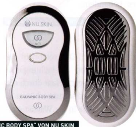
„AGELOC GALVANIC BODY SPA“ VON NU SKIN

Zellen zu erhöhen. Das soll die Ausprägung von Fettablagerungen und Cellulite reduzieren. Dazu das Gerät bis zu dreimal in der Woche über die mit dem Wirkstoffgel vorbereitete Haut gleiten lassen. Infos unter www.nuskin.com