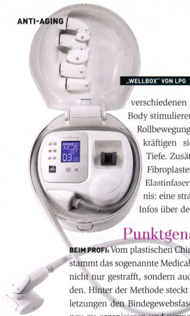
„WELLBOX“ VON LP6

verschiedenen Aufsätze für Gesicht und Body stimulieren mit zarten Klopf-, Knet- und Rollbewegungen die Hautoberfläche und kräftigen sie dabei gleichzeitig in der Tiefe. Zusätzlich regen Mikroimpulse die Fibroplasten an, vermehrt Kollagen- und Elastinfasern zu produzieren. Das Ergebnis: eine straffere und jugendlichere Haut. Infos über de.wellbox.com